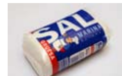
Paquete de sal