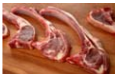
Chuletas de cordero