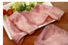
Lonchas de jamón york