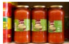
Bote de tomate