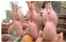
Un pollo entero