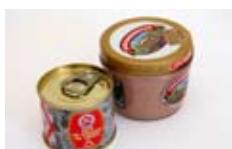
Tarro de foie gras