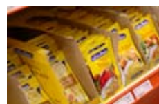
Sobre de sopa