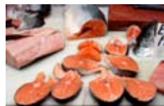
Rodajas de salmón