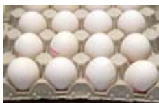
Docena de huevos (12 huevos)