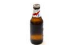
Botellín de cerveza