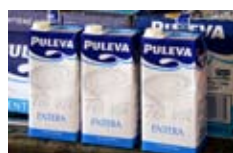
Cartón de leche