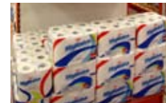
Rollo de papel higiénico