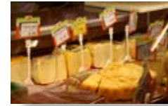
Trozo de queso