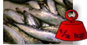
Medio kilo de sardinas