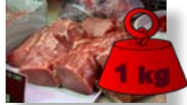
Un kilo de carne