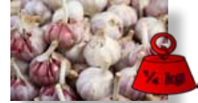
Un cuarto de kilo de ajos