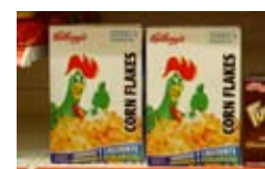
Caja de cereales