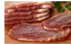
Filetes de cerdo