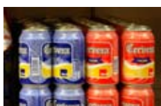
Lata de cerveza