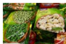
Bolsa de verdura congelada