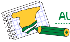
LÁMINA 5.7 LA TIENDA