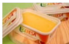
Tarrina de mantequilla