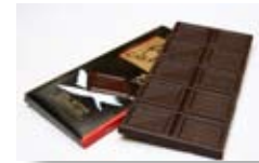
Tableta de chocolate