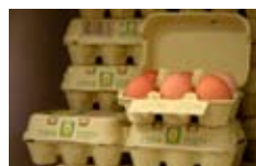
Media docena de huevos (6 huevos)