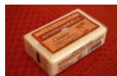
Pastilla de jabón