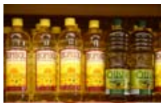
Botella de aceite